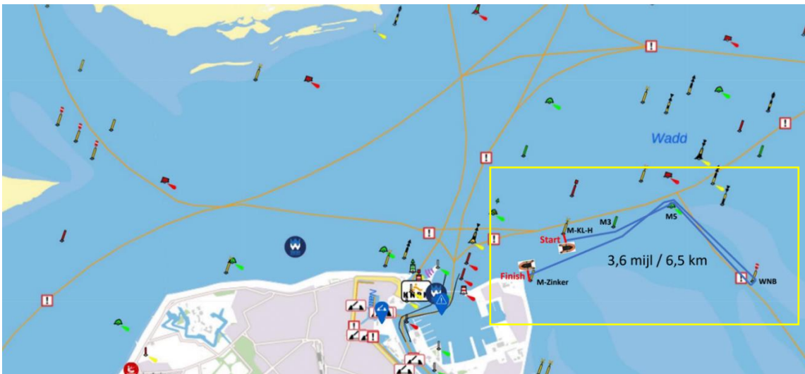
Figuur: Overzicht van Marsdiep Den Helder met ingetekende wedstrijdbaan, aangegeven in blauw