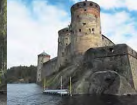
Het Olavinlinna kasteel in Savonlinna