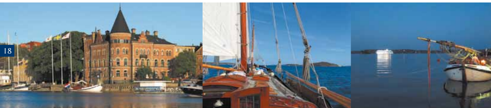
Afgemeerd in Lidingö, bijna winterklaar

Op een zonnige zaterdagochtend was het zover, de Zomertocht! Met geen zuchtje wind en 28 graden zon werd koers gezet richting het wad. Na een aantal dagen zijn wij daar drooggevallen bij het wierumerwad. Een aantal meter van ons vandaan zat een enorme mosselbank. De buit: 3 emmers mosselen en 1 emmer vol met oesters! Het was heerlijk slurpen terwijl wij voor de haven van Schiermonnikoog voor anker lagen. Vervolgens hebben we een klap gemaakt richting het zuiden. 3 dagen lang heerlijk met de halfwinder gezeild op de Noordzee om vervolgens aan te komen in Scheveningen! Hier stond een culturele middag op de planning, we gingen 'oh oh Den Haag' een bezoekje brengen. We verdeelden ons in 2 groepen. Elke groep kreeg een lijst met opdrachten mee. Het is een wonder dat Den Haag nog staat want er zijn heel wat gekke fratsen uitgehaald daar! Na het avontuur in Den Haag voeren we door naar de volgende bestemming: Ouddorp. Hier was een enorme schans waar we met zijn allen vanaf konden glijden. We werden meters de lucht gekatapulteerd, om vervolgens 'zacht' in het water te landen. Na dit avontuur zijn we snel doorgevaren richting Antwerpen! Hier hebben we een heerlijke avond gehad, om vervolgens koers te zetten richting de eindbestemming: Vlissingen. Het was een fantastische tocht. Het weer zat bijna altijd mee, het eten was verrukkelijk en er is een recordaantal flauwe grappen gemaakt. Kortom, een tocht om nooit te vergeten!