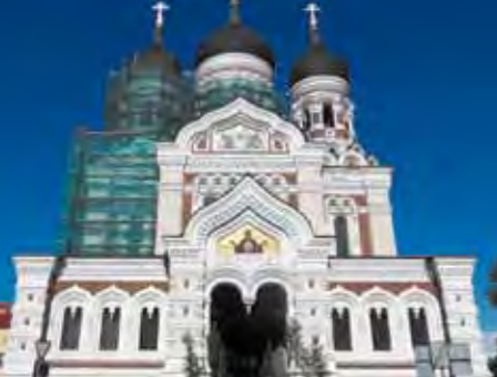
Tallinn, Alexander Nevsky Kathedraal en zeemijnen als vlaggenstokhouders