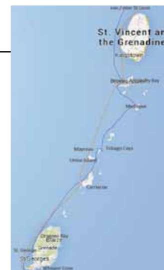
Kaartje van onze cruise door The Grenadines en Grenada

Gratis wifi als je een paar dollar in de collectebus stopt voor het schoolgeld van de kinderen op Carriacou.