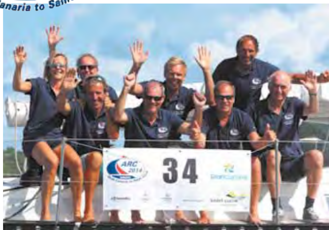
De Crew van de King's Legend bij aankomst in Saint Lucia