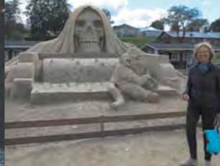
Zandkasteel in Lappeenranta, Saimaa meer