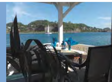
BB's Crabback, The Carenage. St. Georges, St. George's, Grenada. 473 435 7058. bbscrabback@hotmail.com