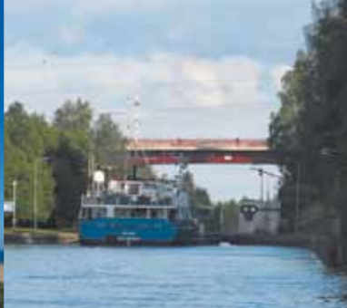
Ingang van het Saimaa kanaal