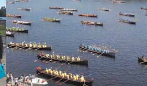
Church Boats race in Sulkava