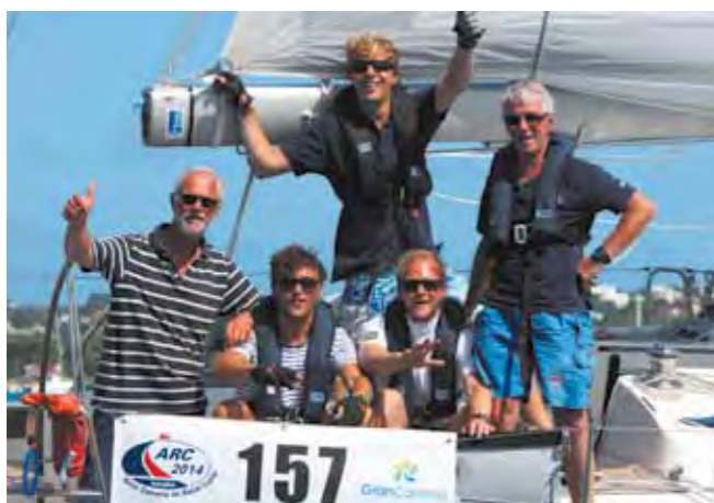
De Crew van de Bombyx