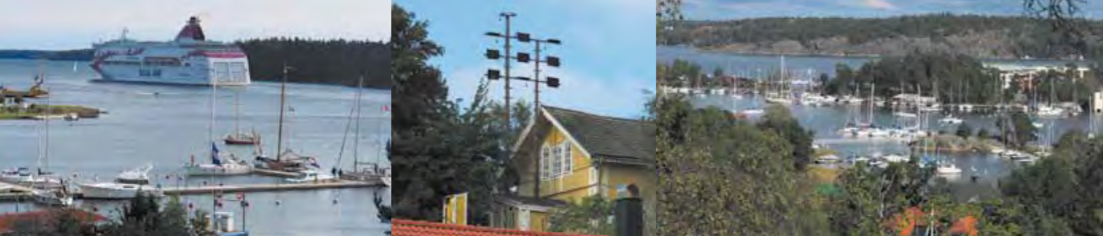
Furusund, ook voor de ferries de toegangsrouten Furusund, de Optische Telegraaf Saltsjöbaden, ZO van Stockholm, één van de twee havens van de KSSS