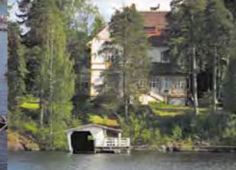
Vakantieverblijf aan het Saimaameer